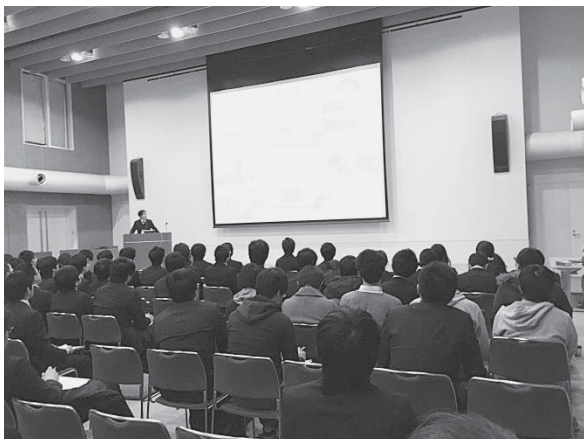
図 1 講演会にて技術講演を聞き入る学生諸君