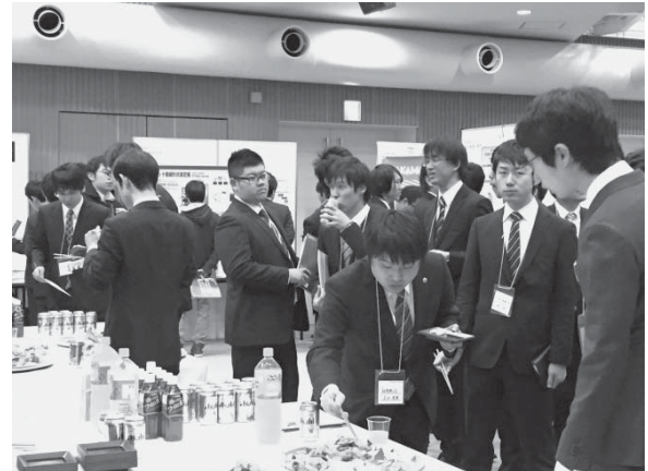
図4 のどを潤しながら談笑も

りました。回収したアンケートは、事務局でまとめ、学生が提示した企業に個別にフィードバックさせていただきました。この講演会は、来年度も継続して企画していきますので、参加された企業の方々には、今後の講演会参加のご参考にしていただければと存じます。