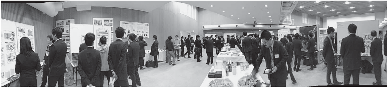
図2 技術交流会全景. 各所で盛んに議論が進む.