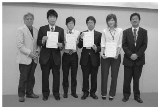
図16 2008年度北海道支部学術講演会・優秀プレゼンテーション賞受賞学生を囲んで