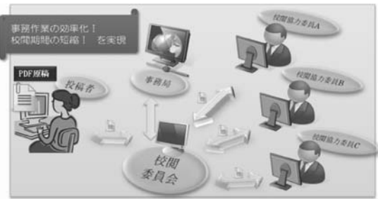
図5 電子校閲システム概念図