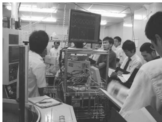
図21 東海支部・ものづくり実践講座