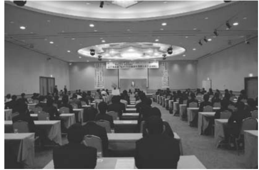
図 18 東北支部・記念講演会「ものづくり技術と医用システム開発」