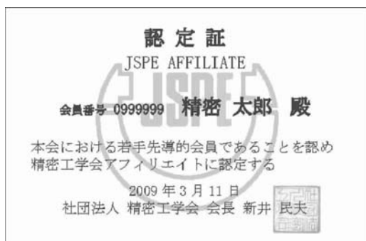
図13 アフィリエイト認定証