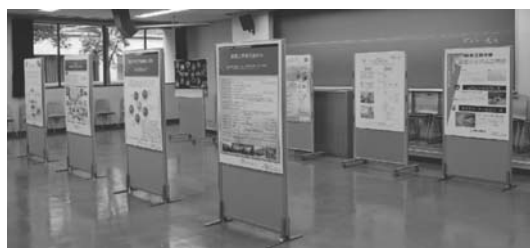
図3 75周年記念ポスター展示

深くスケールの大きな内容で、今後、精密工学会が進んでいくべき方向、国際展開などに関して大いに示唆を受けることができた。