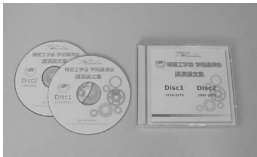
図 11 学術講演会講演論文集 DVD