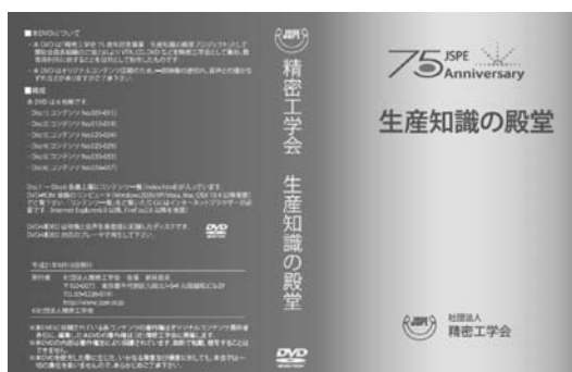
図8 精密工学会 生産知識の殿堂 (DVD一式)

は、(株)アマダ、オーエスジー(株)、大阪機工(株)、独立行政法人産業技術総合研究所、新東プレーター(株)、東芝機械(株)、(株)ナノ、パナソニック(株)(旧:松下電器産業(株))、(株)牧野フライス製作所、(株)森精機製作所、ヤマザキマザック(株)(50音順)である。厚く御礼を申し上げます。