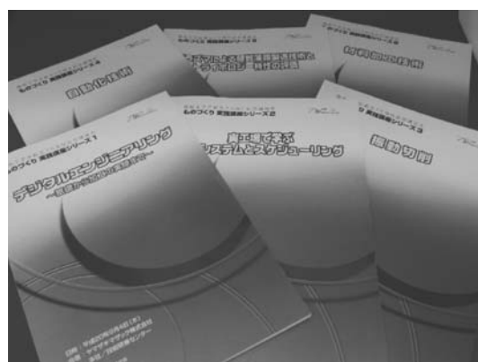
図22 東海支部・ものづくり実践講座用テキスト

新潟県内にある特徴的な企業の現場をみることでモノづくり技術のすごさを実感してもらうよう、専門家による解説とアトラクションを加えて企画した。参加者は11組の小学校5年生とその保護者である。まず、柏崎市の新潟富士ゼロックス製造(株)を訪れた後、燕市産業資料館を見学した。午後は三条市の(株)コロナを訪問し、ペットボトルに入れた空気の圧縮と昇温の実験を体験した。将来の技術者確保のためには、むしろ保護者の啓発が重要であると実感した。