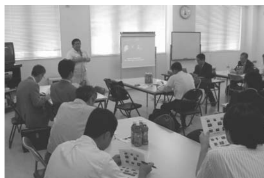
図17 東北支部・出前産学官交流会

全国大会にて発表する学生にとっては大きな刺激になり、彼らの今後の研究に対するモチベーションを高めている。2010年春季大会へも引き続き学生派遣を予定している。