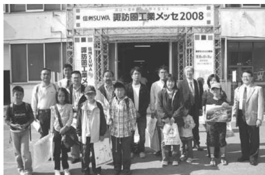
図19 北陸信越支部・“まるごと見よう！ 精密工業”