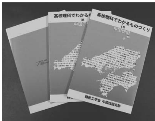
図 24 “高校理科でわかるものづくり in 中国・四国”

たって製造業の人材不足が懸念されている。このような現状にかんがみ、中国四国支部では、高校生を読者対象として、理数系科目の学習内容が日常生活で用いられている製品やその製造過程にどのように生かされているかを解説する小冊子を作成した（図 24）。中国四国圏内には普通科高等学校、工業高等学校が合わせて 700 校余りに小冊子を一冊ずつ無償配布した。