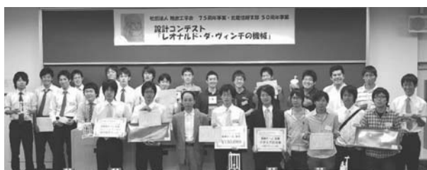
図20 北陸信越支部・“レオナルド・ダ・ヴィンチの機械”の参加者