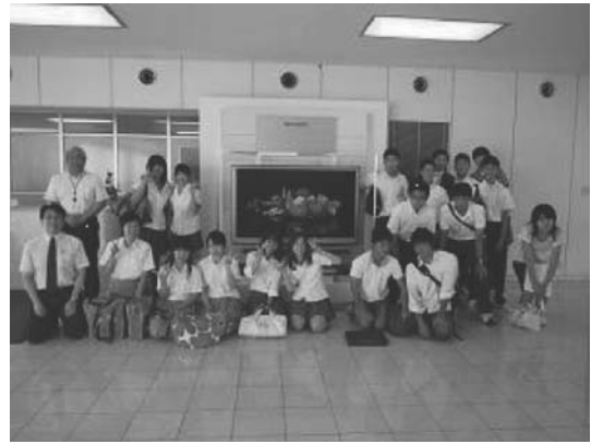
図23 関西支部・高校生を対象とした精密工学モノづくりセミナーによるシャープ(株)総合開発センターの見学