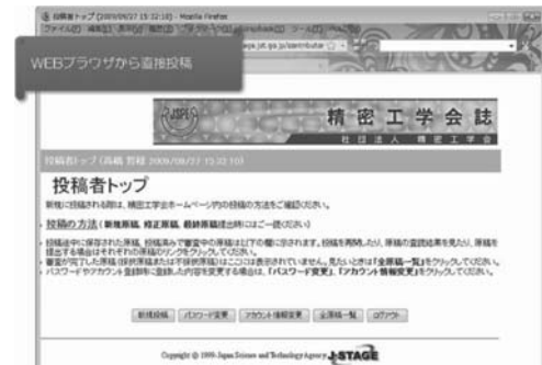
図6 電子校閲システムトップページ

空・宇宙、環境、医療福祉など、これから精密工学の応用が期待される分野の解説記事を掲載した。ここでは、未来の精密工学を担う学生会員からの意見として、学生編集委員会で企画した学生同士の座談会の様子も収録している。