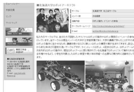
図15 北海道支部ホームページの例（サークル紹介）

次に支部学術講演会において優秀な講演を行った学生に対して優秀プレゼンテーション賞として精密工学会春季大会参加のための旅費を補助している（図16）。2009年春季大会へは、大学院生2名、高専生2名の計4名を派遣し、それぞれが充実した発表、意見交換を行った。初めて