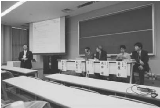
図 10 2009年精密工学会秋季大会シンポジウムの様子