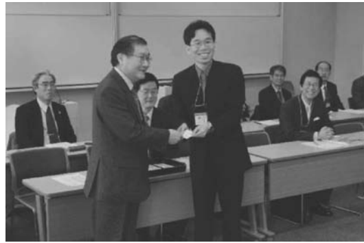
図 12 アフィリエイト認定式の模様